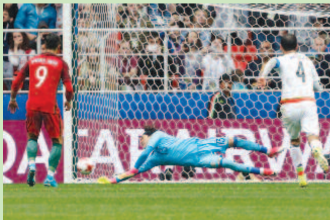
Guillermo Ochoa mexikói kapus kivédi a portugál Andre Silva (b) 11-esét a labdarúgó Konföderációs Kupa harmadik helyéért játszott Portugália – Mexikó mérkőzésen a moszkvai Szpartak Stadionban 2017. július 2-án.

Az eredmény: Konföderációs Kupa, bronzmérkőzés: Portugália – Mexikó 2-1 (0-0, 1-1, 2-1). Gólszerzők: Pepe (90+1.), Silva (104., 11-esből), illetve Neto (54., öngól). Kiállítva: Smedo (106.), illetve Jimenez (112.).